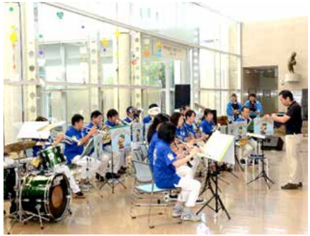
マロニエウインドオーケストラ