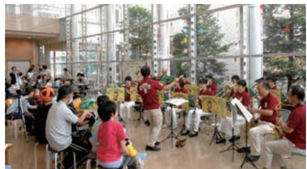
マロニエウインドオーケストラ